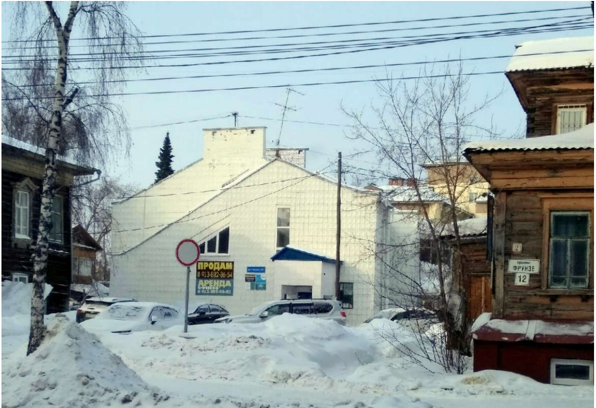
Ил. 3. Город Томск, пр. Фрунзе 10-1. 2019 г.