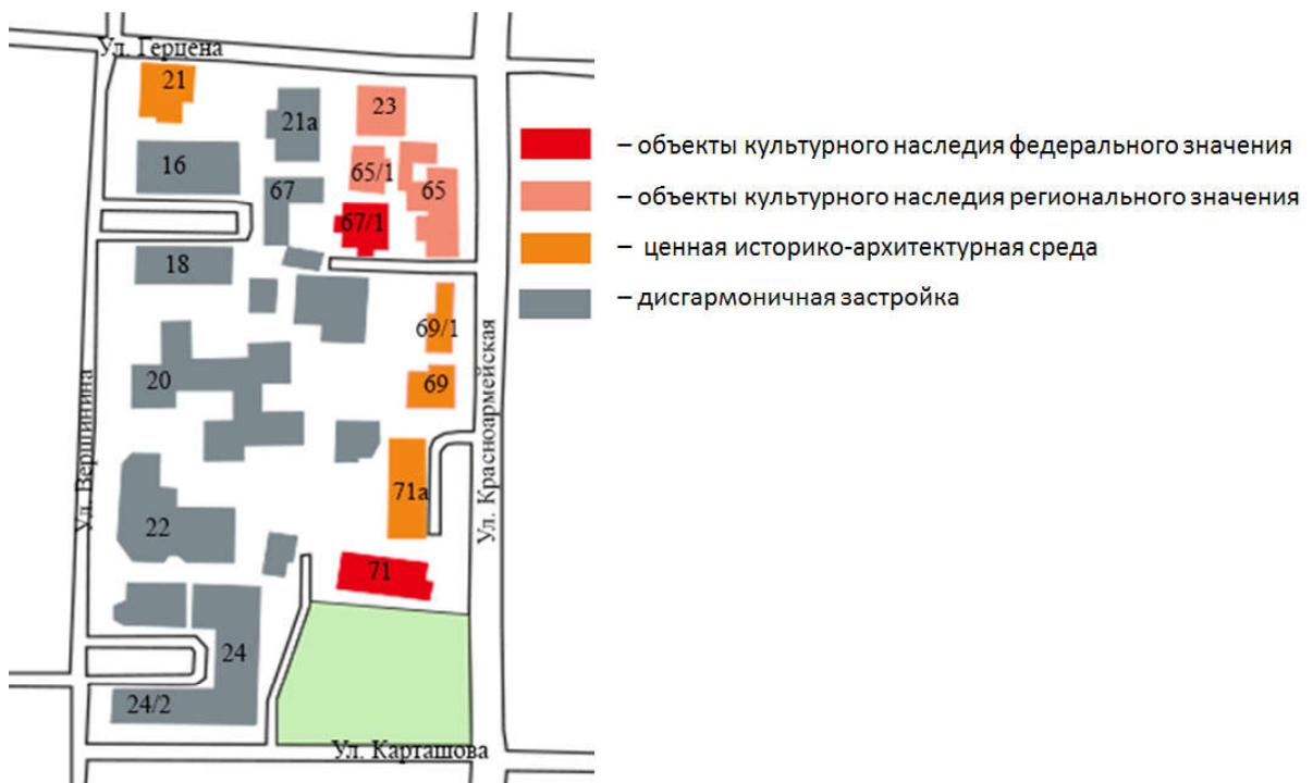
Ил. 4. Историко-культурный опорный план квартала №304 в г. Томске на 2019 г. Графическая схема автора.