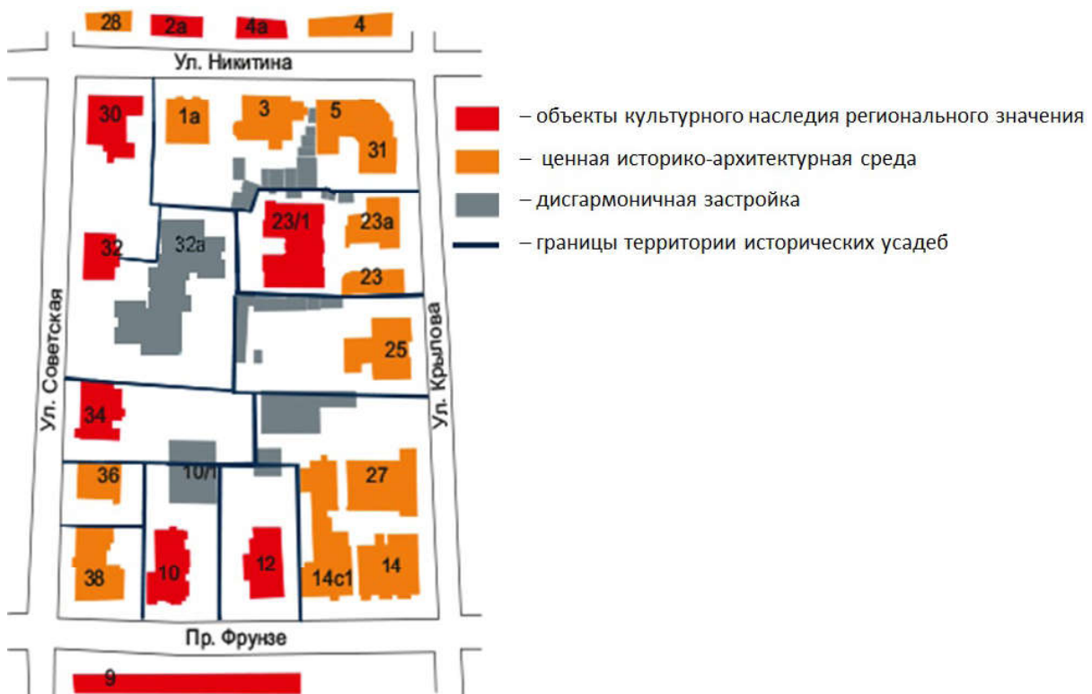
Ил. 1. Историко-культурный опорный план квартала №244 в г. Томске на 2019 г. Графическая схема автора