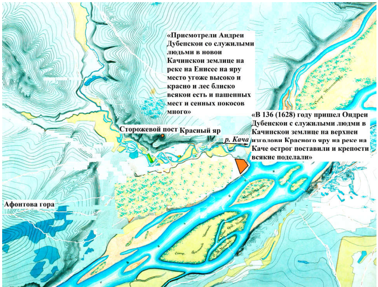
Ил. 2. Графическая реконструкция местоположения Красноярского острога 1628 г. Выполнили авторы