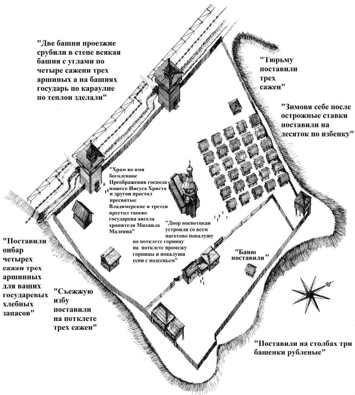
Ил. 3. Графическая реконструкция Красноярского острога 1628–1629 гг. Выполнили авторы