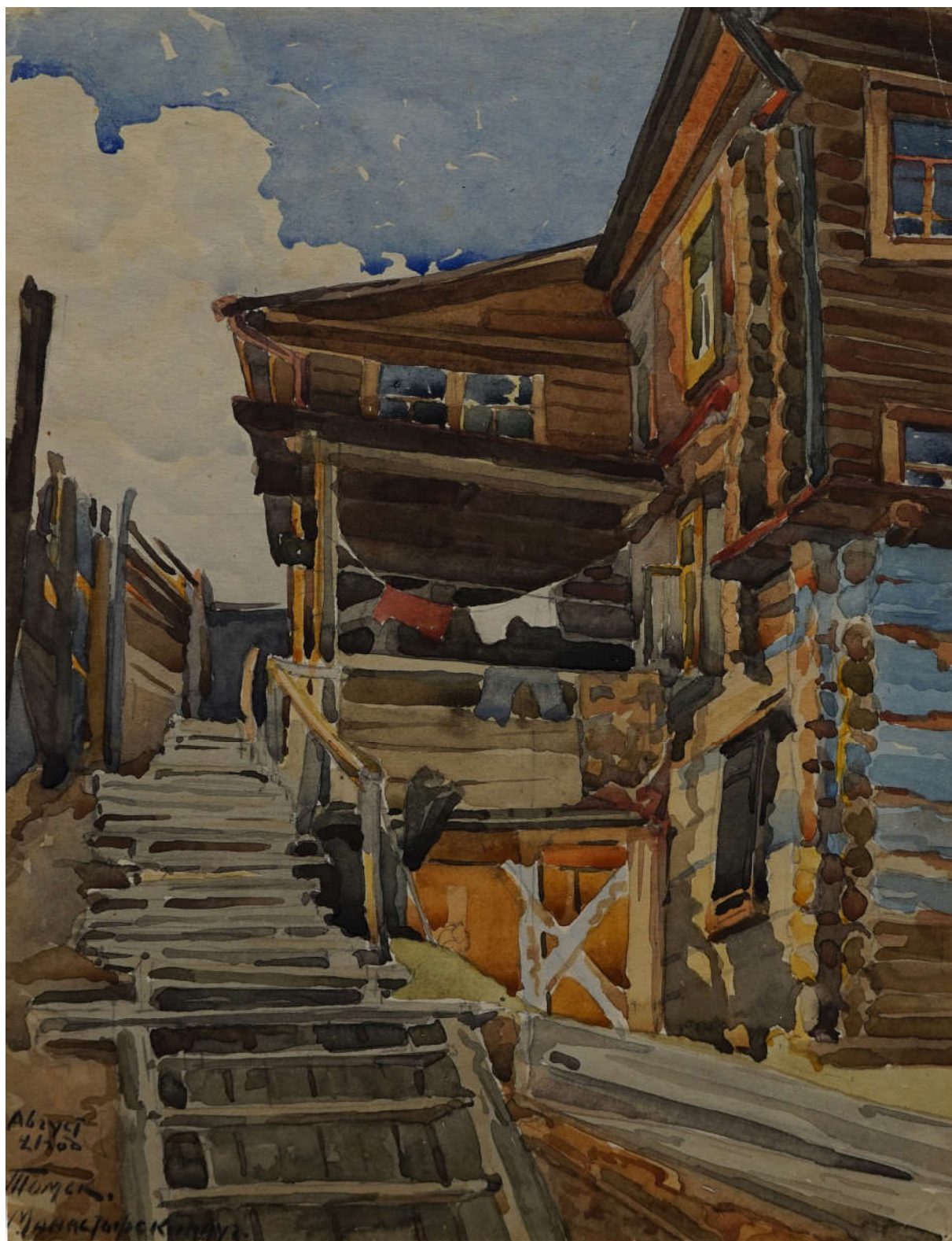
Ил. 4. В.М. Мизеров. Монастырский луг. Томск. 1921 г. Из фондов ТОХМ