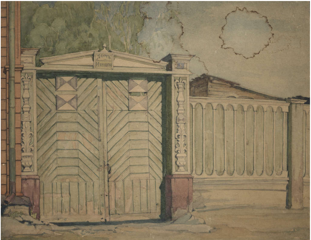
Ил. 1. А.Л. Шиловский. Переулок Банный, 4.

ТОХМ — Томский областной художественный музей