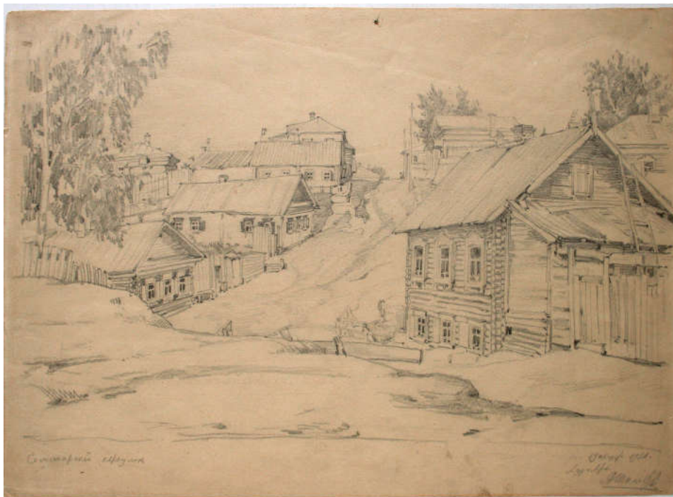
Ил. 2. А.Л. Шиловский. Семинарский переулоч.