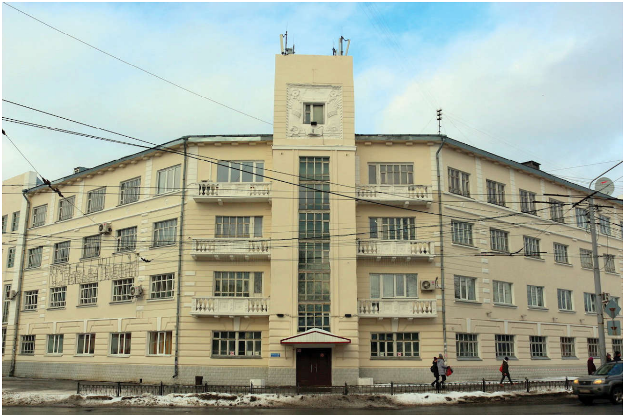
Ил. 2. Комплекс мукомольно-элеваторного учебного комбината. 1932–1938 гг. Арх. Ф.К. Кресadlo.