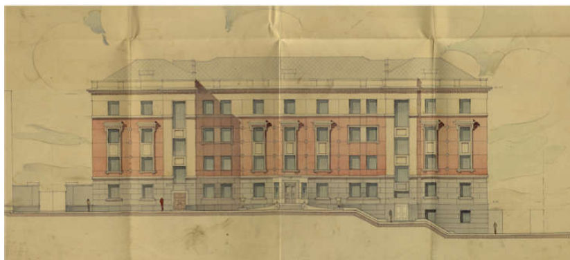
Ил. 3. 1 — проект здания Сибирского химико-технологического института. 1930 г. Перспектива [Угол Буткевской..., 1930]. Реализован объем по ул. Советской (на перспективе — справа); 2 — учебный корпус горного факультета индустриального института. Оформление фасадов — Б.А. Алексеев. Снимок конца 1930-х гг. [Алексеев Борис...]