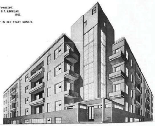
АРХ.-ЭУД. А. З. ГРИНБЕРГ. „ДОМ КОММУНА“ В Г. КЛИНЦАХ. 1927. A. Z. GRINBERG. „KOMMUNALHAUS“ IN DER STADT KLINTZY.