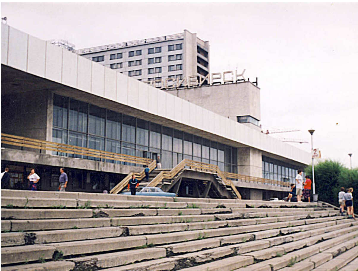
Ил. 5. Здание речного вокзала, 1974 г., арх. А. Воловик, Ю. Захаров, М. Пирогов