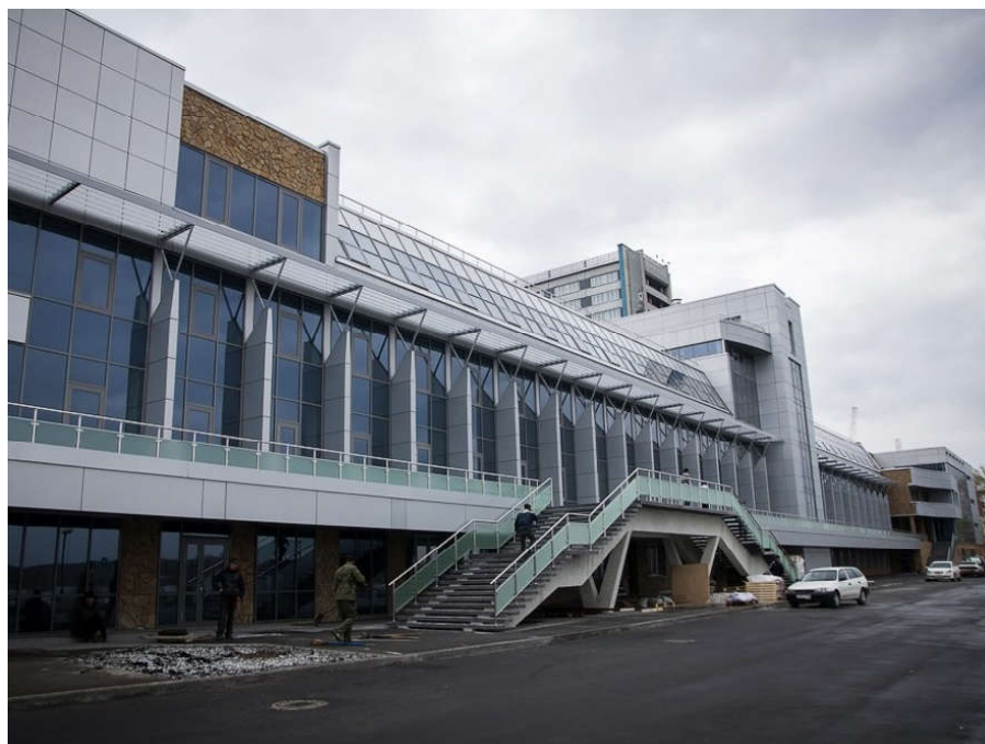
Ил. 6. Здание бизнес-центра «Речной вокзал», 2013 г., проект ООО «АрхиГрад», рук. проекта арх. А. Перминов