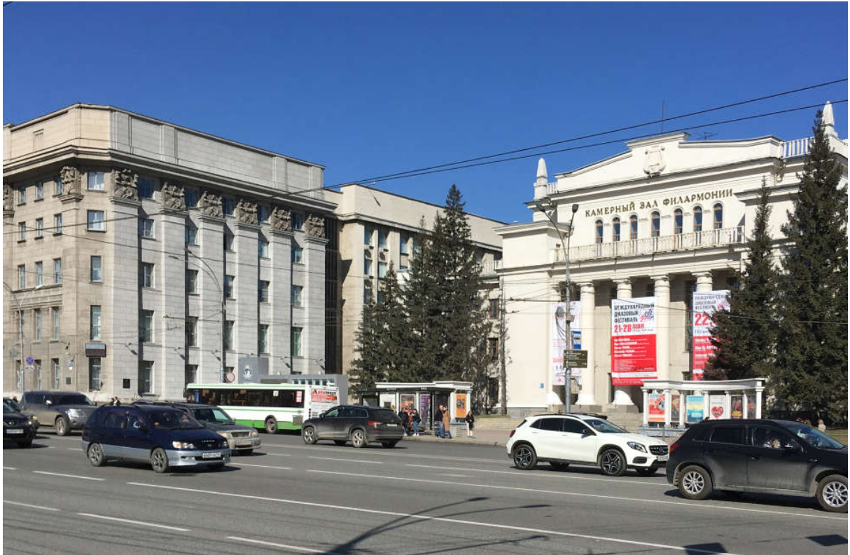
Ил. 7. Пристройка к Новосибирскому Горисполкому (в центре), конец 1970-х гг., арх. Н. Казаков, Г. Дергай