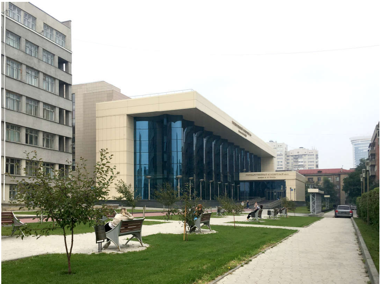
Ил. 4. Государственный концертный зал имени Арнольда Каца, 2013 г., проект В. Ермишкина