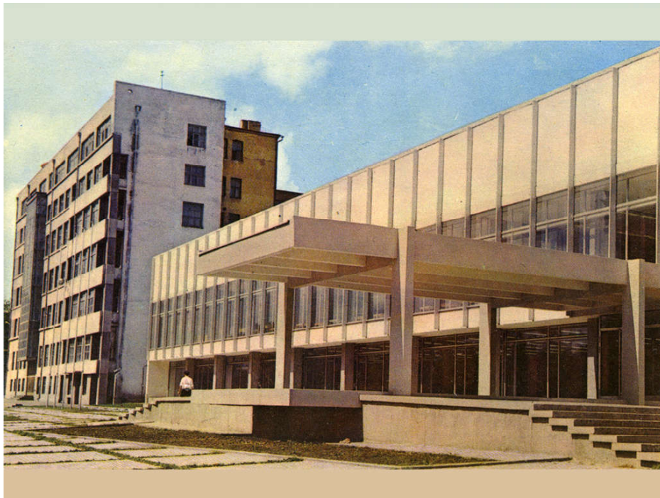
Ил. 3. Дом политпросвещения, 1967 г., арх. Б. Захаров