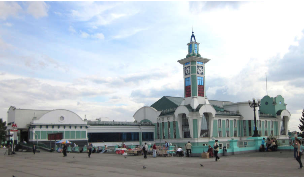
Ил. 2. Павильон пригородных касс, 2005 г., арх. Ф. Бунтовский, инженер О. Башарина