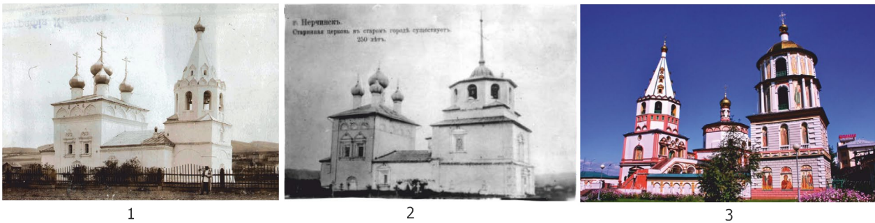
Ил. 4. 1 – Нерчинская Успенская церковь, построена в 1708–1712 гг. 2 – церковь во имя Святой Живоначальной Троицы в Нерчинске, построена 1712–1720 гг. 3 – вид Иркутского Богоявленского храма с южного фасада со стороны лестницы ( http://www.forbes.ru/reitingi-photogallery/239495-30-luchshih-gorodov-dlya-biznesa-2013-reiting-forbes) Fg. 4. 1 – Nerchinsk Assumption Church, built in 1708–1712 ; 2 – The Holy Life-giving Trinity Church built in 1712–1720 ; 3 – View of the Irkutsk Epiphany Church, the southern facade from the side of stairs ( http://www.forbes.ru/reitingi-photogallery/239495-30-luchshih-gorodov-dlya-biznesa-2013-reiting-forbes)