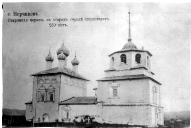
Ил. 2. Нерчинский соборный Троицкий храм с пристроенной к нему колокольней (снимок конца XIX в.)

Для уточнения этажности Нерчинского Троицкого храма было проведено сопоставление панорамного изображения Нерчинска с тщательно прорисованными силуэтами двух церквей и колокольни, выполненного И.В. Люрсениусом в 1736 г., графического рисунка Троицкого храма художника-самоучки П.Н. Рязанцева 1868 г. и фотографического снимка Троицкого храма конца XIX в. Полученные результаты подтвердили ошибочность суждений новосибирских исследователей о количестве световых рядов у Нерчинского каменного собора. Дело в том, что Люрсениус, скрупулезно вырисов-