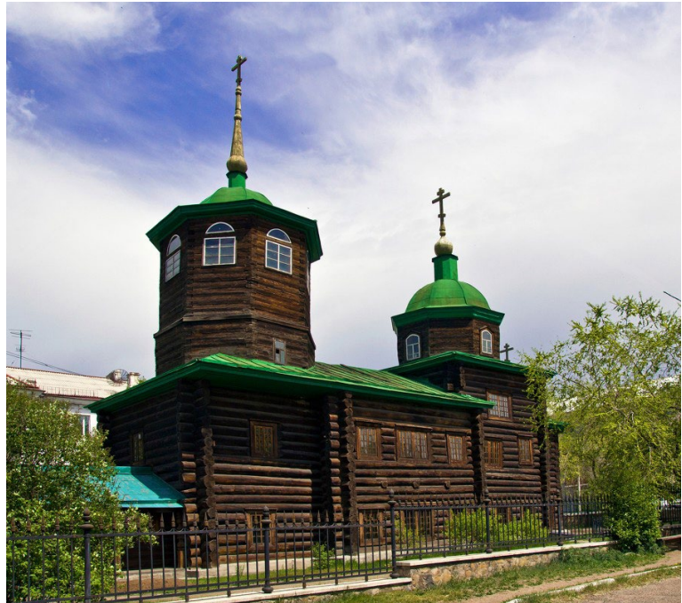
Ил. 5. Современный вид Читинской Михайло-Архангельской церкви

Выводы. Нерчинскую Троицкую церковь можно отнести к широко распространенному в тот период истории типу бесстолпного посадского храма, с одной световой главой на фоне традиционного пятиглавия, с небольшим помещением основного объема здания церкви, двумя ярусами окон на фоне ложного членения стен на этажи и привычным оформлением карниза четверика «килевидными кокошниками» — ложными, декоративными закомарами. Нерчинский соборный