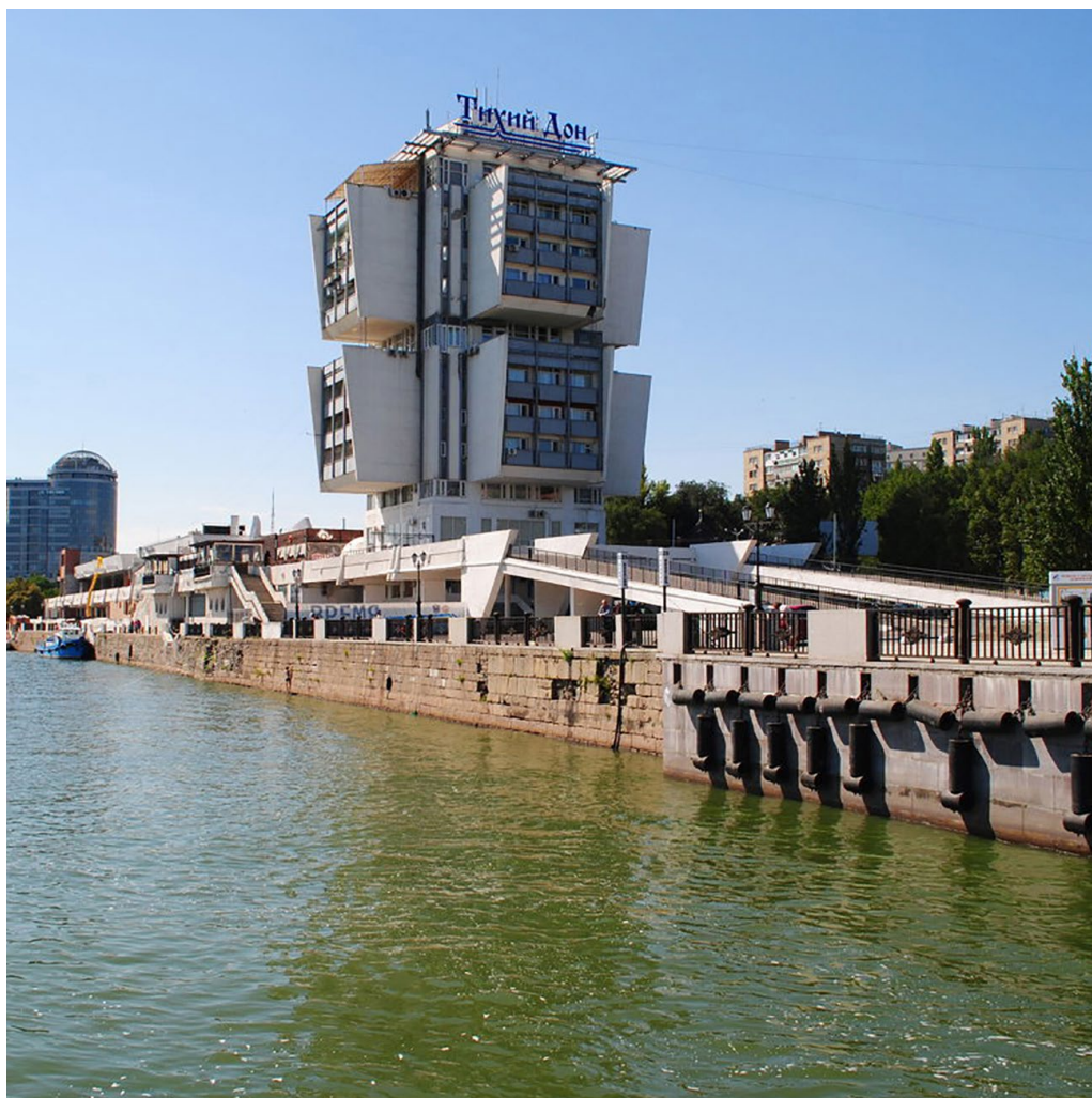
Ил. 6. Речной вокзал в Ростове-на-Дону, 2016 г.

ДонНАСА — Донбасская национальная академия строительства и архитектуры