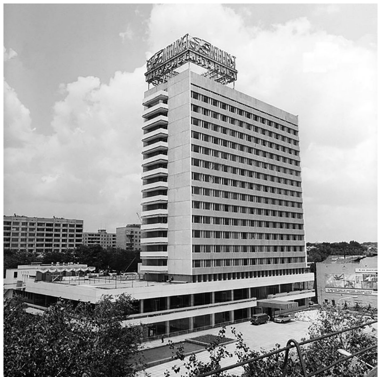
Ил. 1. Здание гостиницы «Интурист» в Ростове-на-Дону, 1973 г.

Сотрудники «Ростовгражданпроекта» стали авторами еще одной ростовской гостиницы — «Туриста». Расположенный на площади Ленина объект был сдан в эксплуатацию в 1979 г. [«Турист» принимает..., 1979]. К двенадцатиэтажному зданию, ставшему основным элементом формирования городского пространства, прилегала благоустроенная террасами и бассейнами территория (ил. 3). В духе приемов модернизма первые два этажа кубического объема гостиницы были объединены высокими витражами, а остальные уровни выполнены с использованием ленточного остекления. Над входной группой, зафиксированной нависающим козырьком, выступил ряд балконов, разбивающий монотонное горизонтальное членение фасада. «Недостаток эмоционального и содержательного наполнения зданий в стилистике советского модернизма зачастую восполняется средствами монументального искусства» [Иванова-Ильичева и др., 2017, с. 101]. В здании гостиницы «Турист» этот тезис нашел свое полное отражение. Торцевая стена объема была облицована цветной мозаичной плиткой, а мощный парапет входного козырька украшала рельефная скульптура. Сегодня в здании «Туриста» находится конгресс-отель «Амакс». Роль вертикального акцента фасада теперь выполняет блок зеркального голубого стекла, закрывающего выступающие раньше балконы. Сооружение