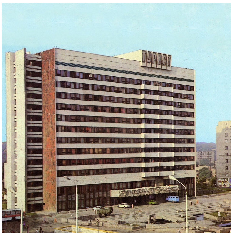
Ил. 3. Здание гостиницы «Турист» в Ростове-на-Дону, 1970-е гг. ( https://chawedrosin.wordpress.com/2009/03/18/soviet-postcards/ )