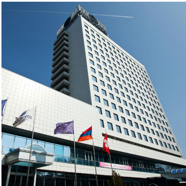
Ил. 2. Здание конгресс-отеля Don Plaza в Ростове-на-Дону, 2018 г. ( https://jalan2eropa.com/cari-hotel/rusia/7667 )