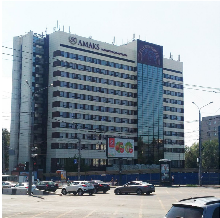
Ил. 4. Здание конгресс-отеля «Амакс» (Amaks) в Ростове-на-Дону, 2010-е гг.