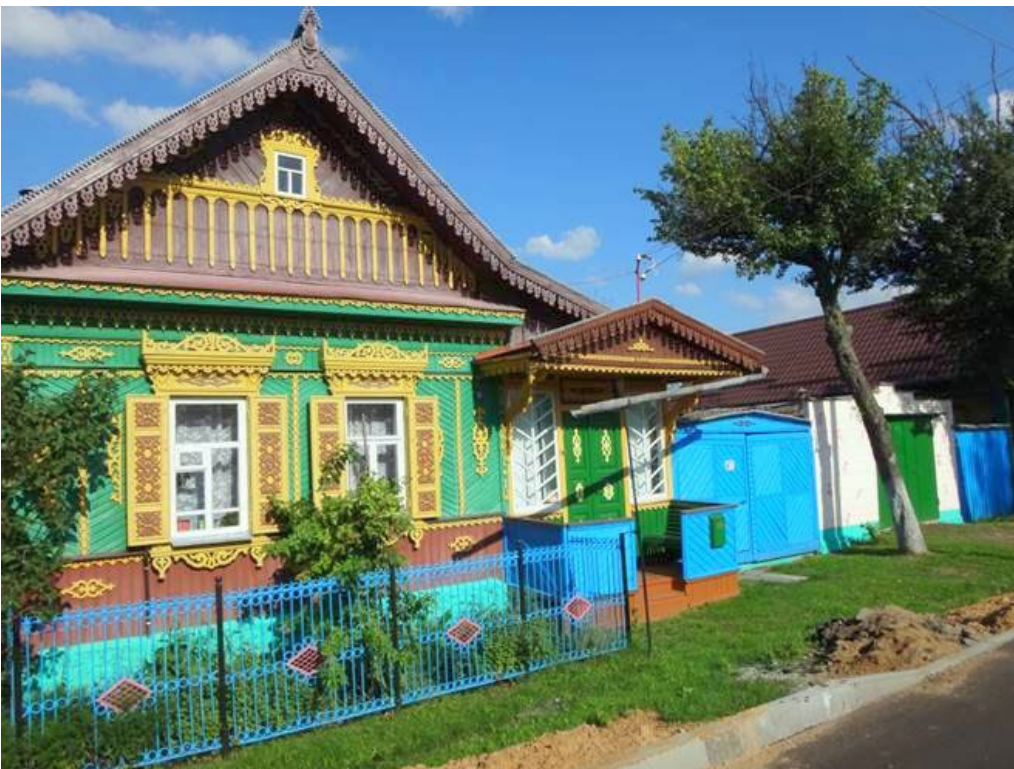
Ил. 6. Декор дома в городе Новозыбков Брянской области. Fg. 6. Home decor in the city of Novozybkov, Bryansk region.