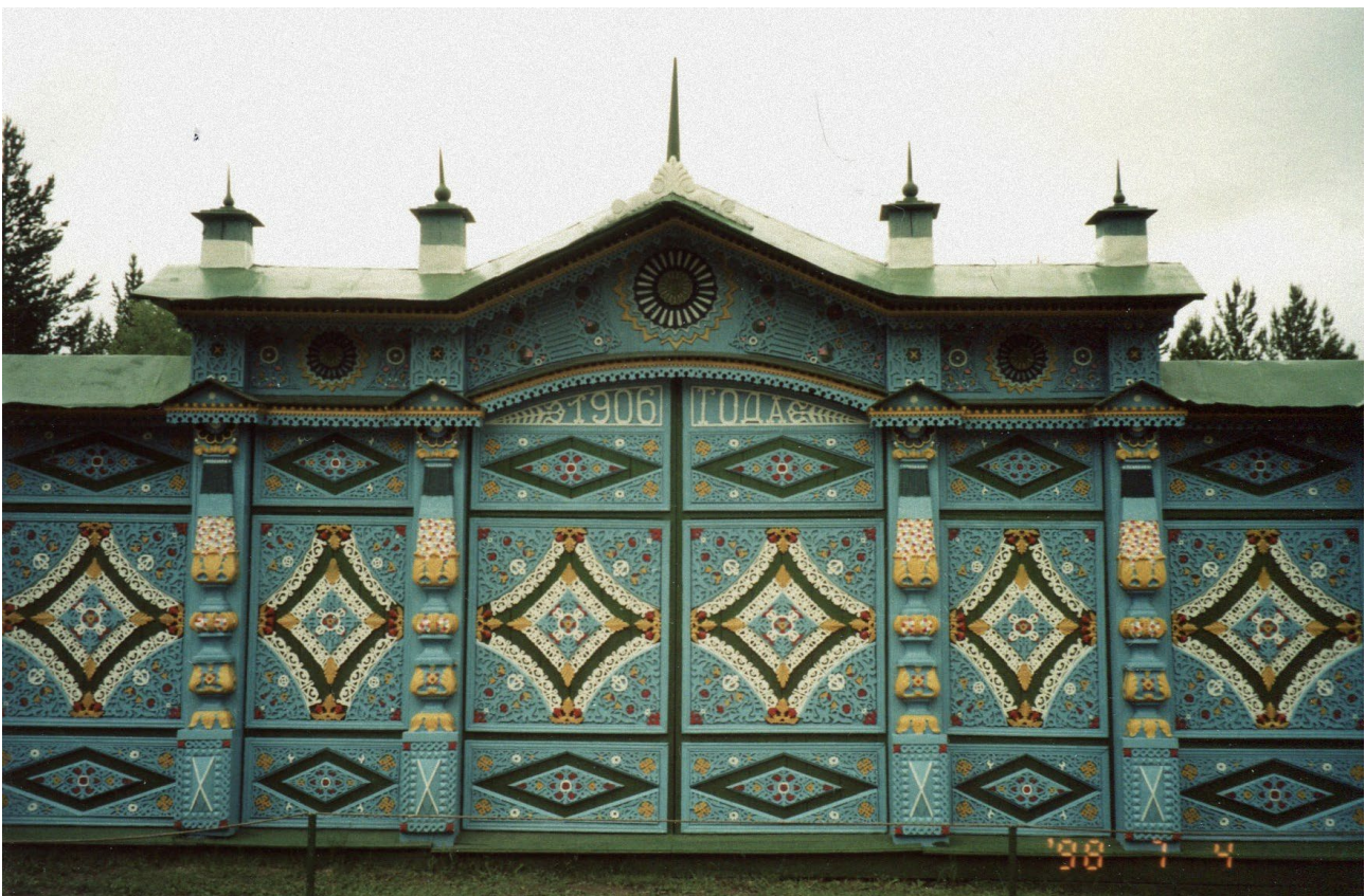
Ил. 2. Расписные ворота из с. Новая Брянь, начало XX в. Этнографический музей народов Забайкалья, Улан-Удэ.