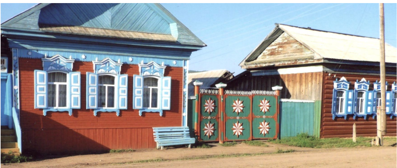
Ил. 4. Современные дома семейских [Болонев, 2015, с. 392] Fig. 4. Modern family houses [Bonlonev, 2015, p. 392]