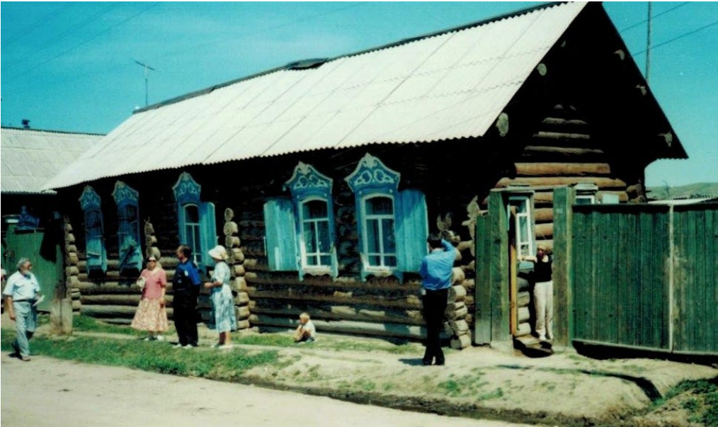
Ил. 5. Декор домов в с. Большой Куналей, Бурятия. Fg. 5. Decor of houses in the village of Bolshoi Kunaley, Buryatia.