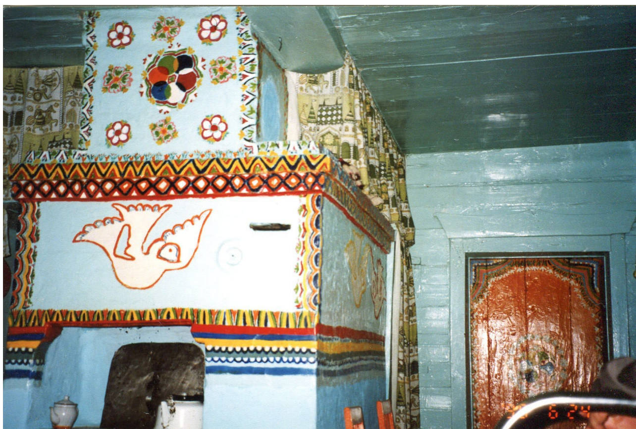
Ил. 3. Расписная печь в с. Десятникове, примерно начало XX в. Расписала Василиса Соколова [Болонев, 2009, с. 87]

Характерной особенностью жилищ семейских старообрядцев является роспись яркими масляными красками стен домов, хозяйственных построек, ворот и заборов. Это придает старообрядческим деревням Забайкалья очень живописный вид (ил. 2–5). Ворота и заборы, так же как и жилые дома, украшали разноцветными фигурами: звездами, ромбами, геометрическими орнаментами. На иллюстрации 2 представлена фотография ворот, которые были изготовлены в 1906 г. для усадьбы богатого крестьянина из села Брянь (название, видимо,