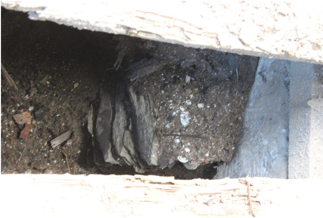
Ил.2. «Прототип» фундамента из сланцевого камня с глиной в доме с. Зарубино Топкинского района Кемеровской области, ПМА.