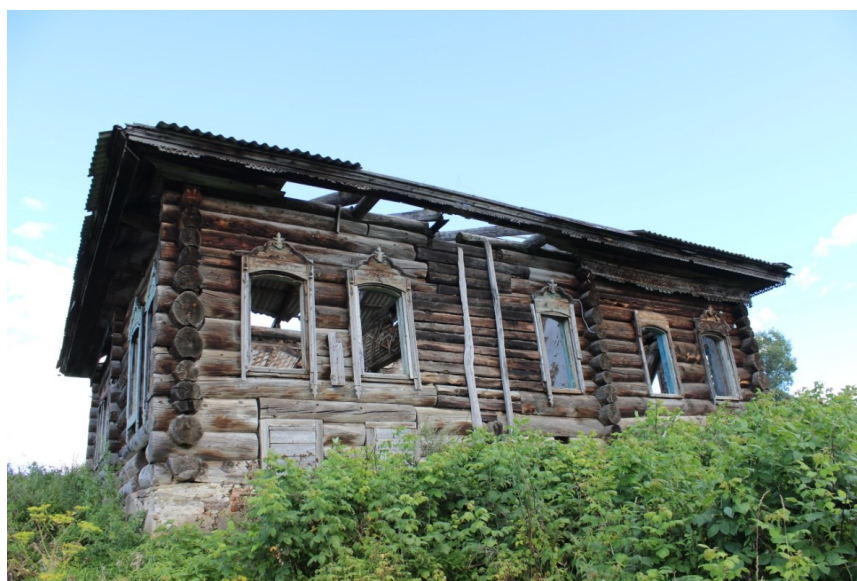
Ил. 1. Жилой дом в с.Зарубино Топкинского района Кемеровской области, ПМА. Fig. 1. Residential building in the village of Zarubino, Topkinsky district, Kemerovo region.

Из-за увеличения численности трудоспособного населения произошел активный экономический рост [Ильиных, 1999, с. 37], следовательно, появились возможности активного развития строительных технологий, т.е. появлению культурной инновации (вернее ее попытках). Данный тезис подтверждается применением достаточно сложных технологических решений в архитектуре крестьянского жилища того периода. Примером сложности таких решений является использование «прототипов» фундаментов для домов на окладном венце, выполненных из сланцевого камня и глины, выполненная в жилом доме братьев Зарубиных в с. Зарубино Топкинского района Кемеровской области (рис. 1, 2).