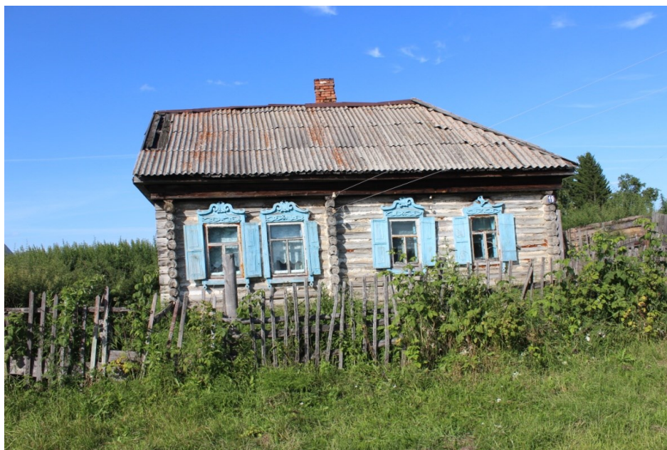
Ил. 3. Жилой дом по ул. Центральная с. Петровка Мариинского района Кемеровской области. Fig. 3. Residential building on the Central street of the village of Petrovka, Mariinsky district, Kemerovo region.