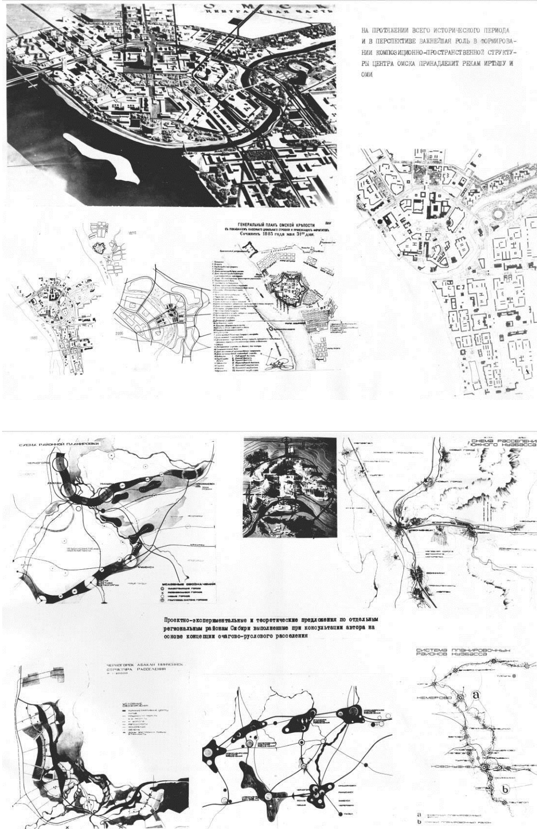
Рис. 3. Материалы экспозиции из II-го тома диссертации Б.И. Оглы на соискание ученой степени доктора архитектуры [5, с. 66, 44]